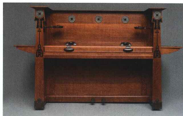
Piano ' Valkyrie ', modèle dessiné par F. Wydburd pour Liberty and Co. Facteur J.J. Hopkinson (ca. 1902) H127 x L210 x P72 cm

La galerie Haesaerts - le Grelle , qui depuis expose ses pièces dans sa nouvelle galerie bruxelloise, s'est principalement focalisée sur le mobilier de l'architecte liégeois, Gustave Serrurier-Bovy. À Antica Namur, elle propose également une sélection Arts and Crafts anglais et en particulier un exceptionnel piano « Liberty and co » de 1902. Avenue Albert 81 – 1190 Bruxelles. +32 (0)2 520 42 34. www.haesaertslegrelle.com . Stand F21