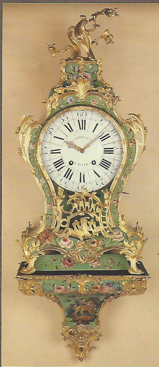
Cartel d'époque LXV en vernis Martin de LAMBRECHTS à Amers, estampillé J. JOLLAIN. Collection Générale de Banque, Amers