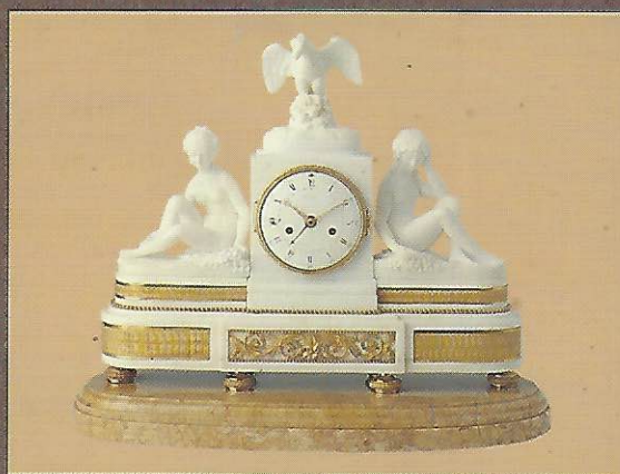
Pendule d'époque LXVI en marbre de Carrare et bronze doré de LÉPINE, Place des Victoires n° 12 à Paris.